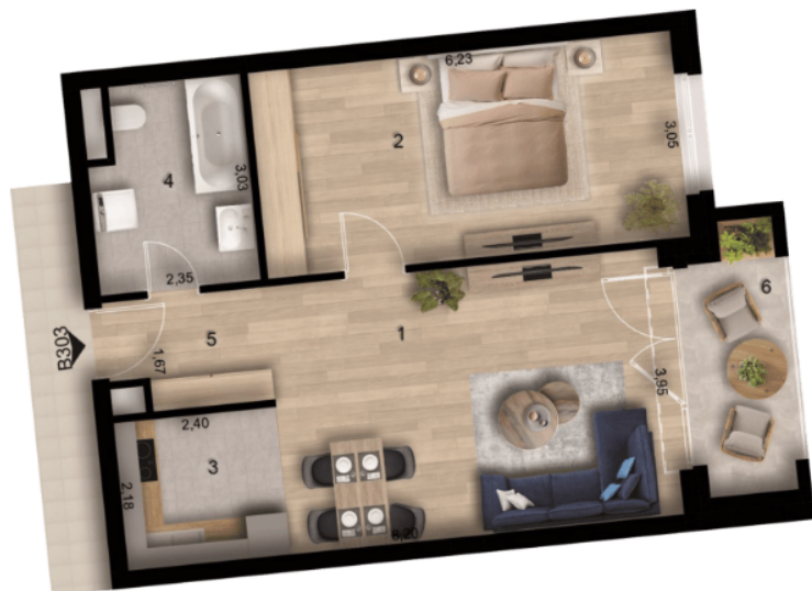
LOCATION OF THE APARTMENT